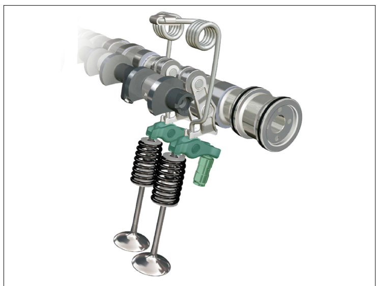
Slika 1: Pregled sistema BMW Valvetronic

Pri motorjih BMW s sistemom Valvetronic in pri motorjih skupine PSA se kategorizirani nihajni vzvodi vgrajujejo tako na stran sesalnih kot tudi na stran izpušnih ventilov.