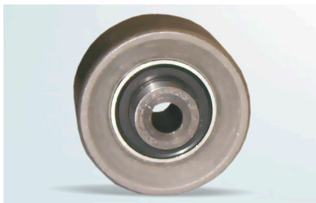
Billede 1: 532 0289 10 – metal design