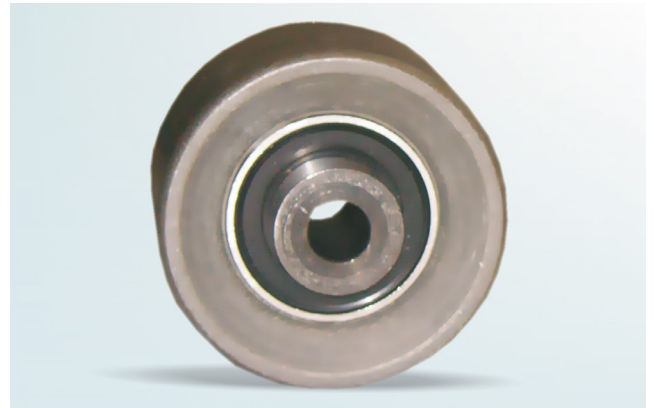
Kuva 1: 532 0289 10 Edellinen malli