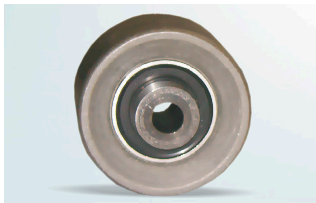
Рисунок 1: 532 0289 10 – металл