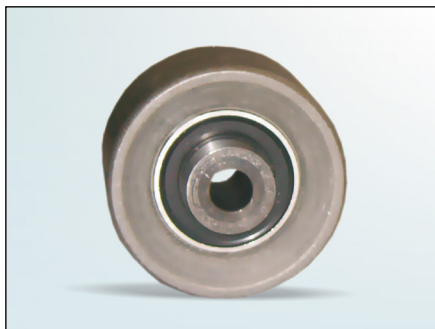
Slika 1: 532 0289 10 - kovinska izvedba