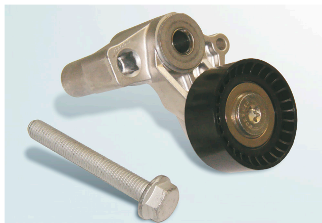
Billede 1: 534 0100 20 – aktuel udførelse

Kun den nye skrue kan anvendes i den nye specifikation. Andre eller gamle skrue tillades ikke! Ved fastgøringskruestramning skal man overholde vridningsmomenterne foreskrevet af køretøjfabrikanten!