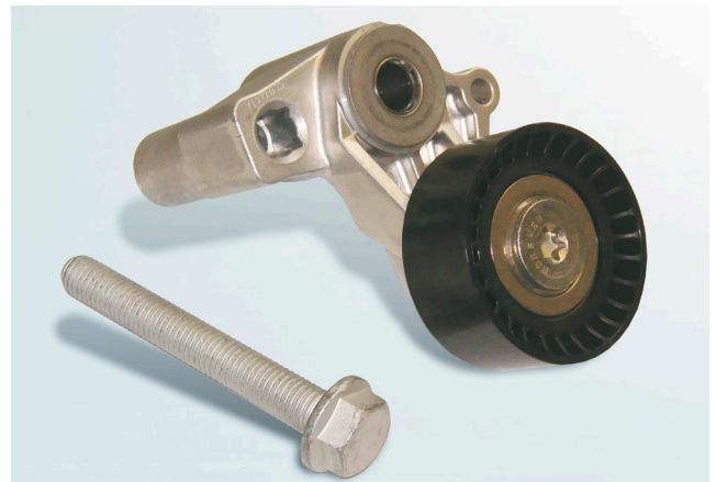
Εικόνα 1: 534 0100 20 – νέος σχεδιασμός

Για την τοποθέτηση του νέου βραχίονα σύσφιγξης πρέπει να χρησιμοποιηθεί μόνο η νέα βίδα που παρέχεται. Δεν επιτρέπεται να χρησιμοποιηθούν άλλες ή παλιές βίδες. Σφίξτε τη βίδα συγκράτησης με την προβλεπόμενη από τον κατασκευαστή του οχήματος ροπή σύσφιγξης!