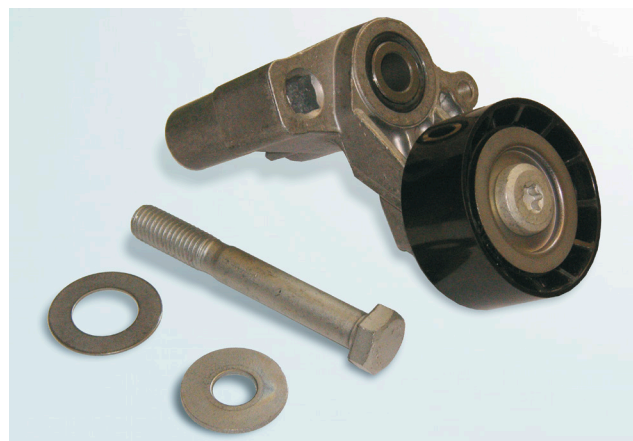
Рисунок 2: 534 0100 20 – предыдущая конструкция

В ходе проведения непрерывных работ по улучшению продукции были внесены изменения в рычаг натяжителя 534 0100 20.