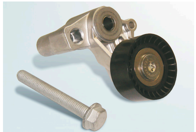
Зображення 1: 534 0100 20 – поточна версія