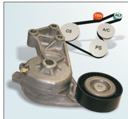
Image 2 : Bras tendeur 534 0132 30 monté dans le moteur 1,9 TDI avec cheminement de la courroie

Sur ce moteur, les bruits peuvent provenir des mouvements très dynamiques effectués par la courroie d'accessoires.