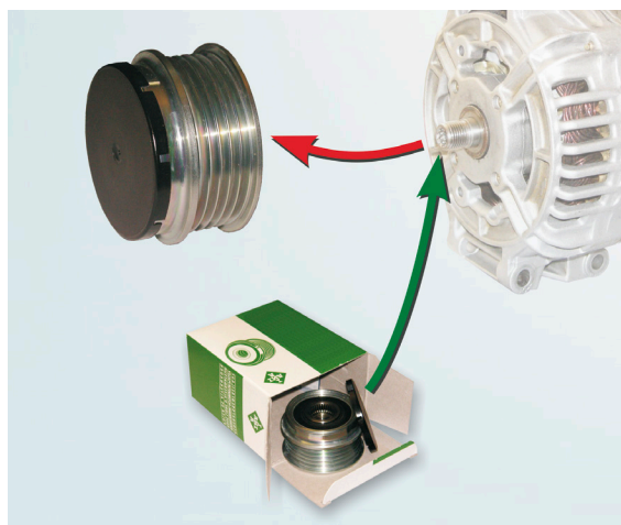
Figura 1: Recomandare: Schimbarea rolei cu roată liberă pentru alternator