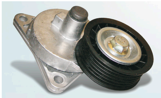
Εικόνα 2: 534 0130 20 - με μαύρη τροχαλία

Προσοχή στις οδηγίες του κατασκευαστή του οχήματος!