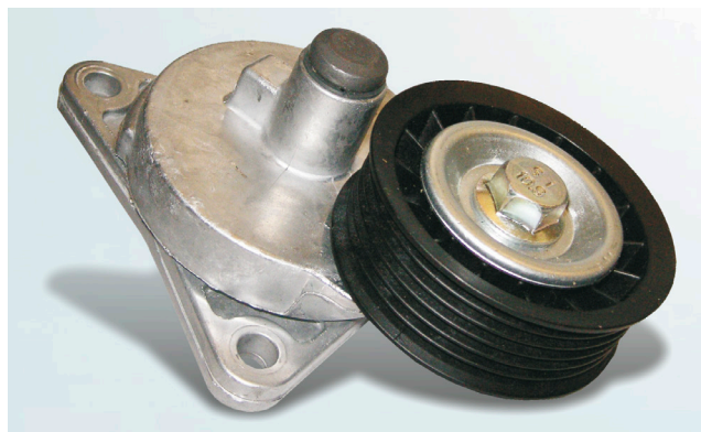
2. ábra: 534 0130 20 - fekete görgővel

Az 534 0130 20 cikkszámhoz a Schaeffler Automotive Aftermarket két eltérő változatot szállít.