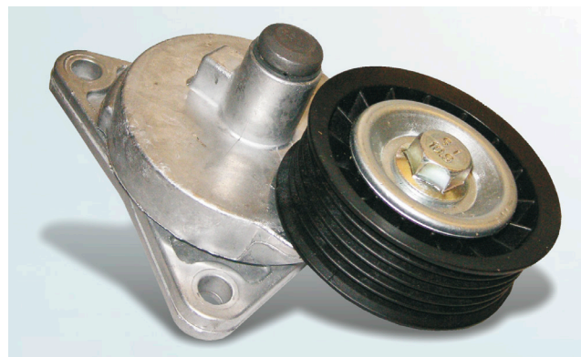
Figura 2: 534 0130 20 – cu rolă de culoare neagră

Respectați specificațiile producătorului autovehiculului!