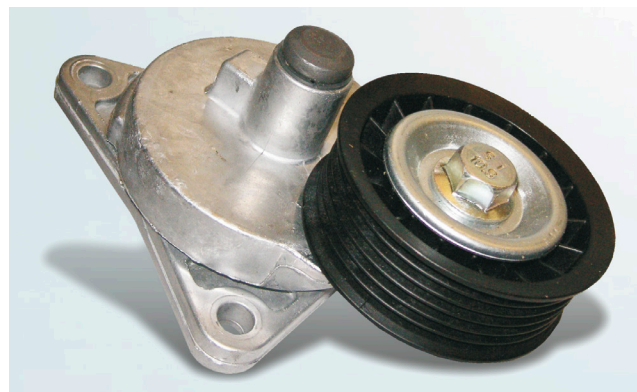
Рисунок 2: 534 0130 20 – с черным роликом

Schaeffler Automotive Aftermarket предлагает две различные версии натяжителя 534 0130 20.