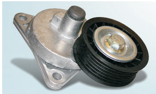
Зображення 2: 534 0130 20 - з чорним роликом

Компанія Schaeffler Automotive Aftermarket пропонує дві різні версії натяжного ролика з артикульним номером 534 0130 20.