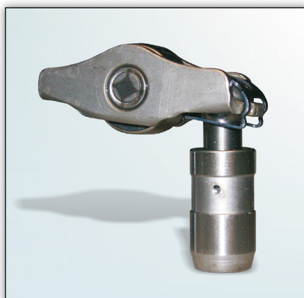
Slika 1: Izvedba 1