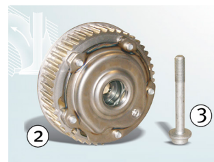
Снимка 2: Дефазатор на разпределителен вал от изпускателната страна 427 1005 10 и централен болт 41301*