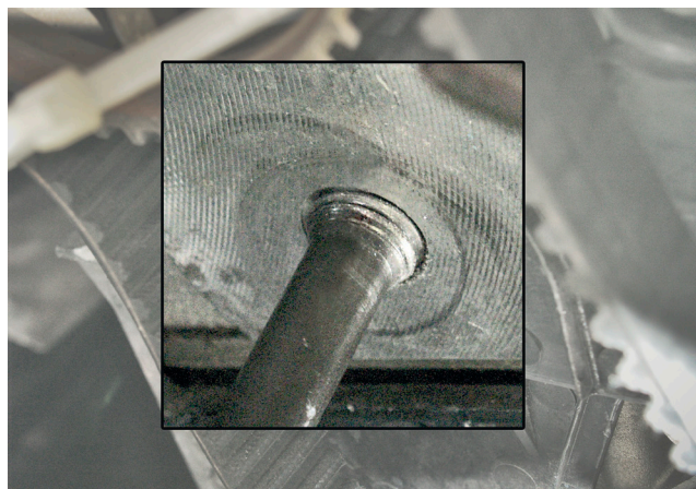
Obrázek 1: Závrtný čep není správně zašroubován

Bezpodmínečně dbejte na to, aby byl závrtný čep se závitem zašroubován do roviny s blokem motoru! Jakákoliv jiná poloha závrtného čepu může mít za následek chybnou funkci napínací kladky!