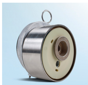
Obrázek 1: Pohled zepředu na dosavadní verzi