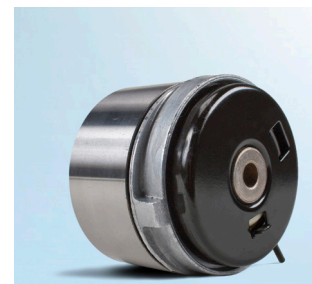
Obrázek 4: Pohled zezadu na novou verzi

Na základě neustálého vývoje našich produktů byla změněna konstrukce napínací kladky 531 0779 10. Tato servisní informace ukazuje optické rozdíly (viz obrázek 1 až 4) obou verzí.