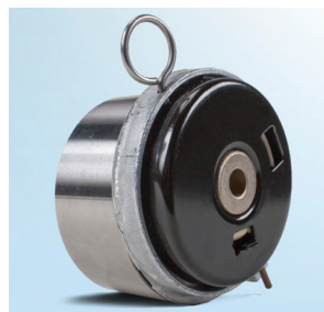
Obrázek 3: Pohled zezadu na dosavadní verzi