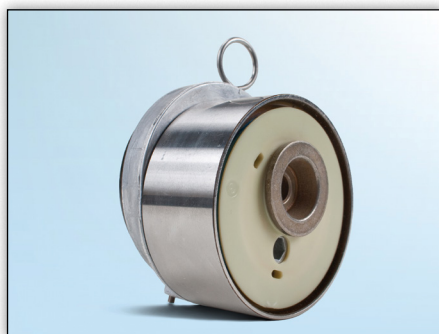
Slika 1: Pogled od spredaj na prejšnji model