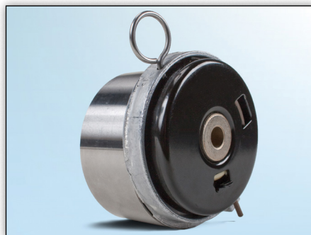
Slika 3: Pogled od zadaj na prejšnji model