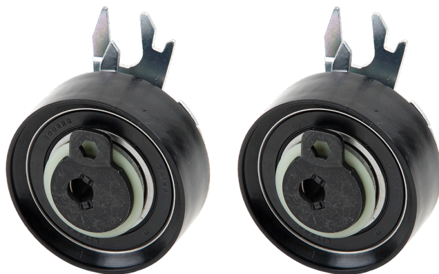
Фигура 1: Вляво – обтяжна шайба 531 0252 30, вдясно – обтяжна шайба 531 0525 30

За настоящият списък направете справка в каталога