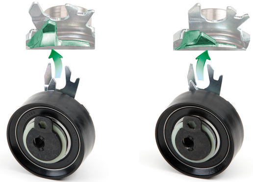
Kuva 1: Vasemmalla - kiristinpyörä 531 0252 30, oikealla - kiristinpyörä 531 0525 30

Kiristinpyörien 531 0252 30 ja 531 0525 30 tapauksessa on vaarana niiden sekoittuminen toisiinsa.