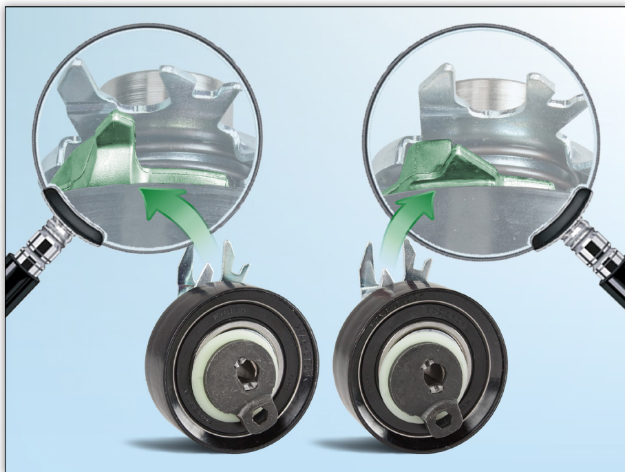
Slika: Različnost između nateznih rolica Kat. Br. 531 0252 30 (lijeva) i 531 0525 30 (desna)

Moguća je nenamjerna zamjena rolica natezača Kat. Br. 531 0252 30 i 531 0525 30 zbog više sličnosti.