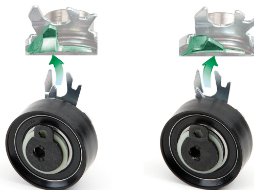
Bild 1: Vänster - spännrulle 531 0252 30, höger spännrulle 531 0525 30

Som följd av förväxling mellan spännrullarna kan det medföra svängningar uppstår i kuggremmen, samt även att den hoppar över. Som följd därav kan man inte utesluta motorskador.