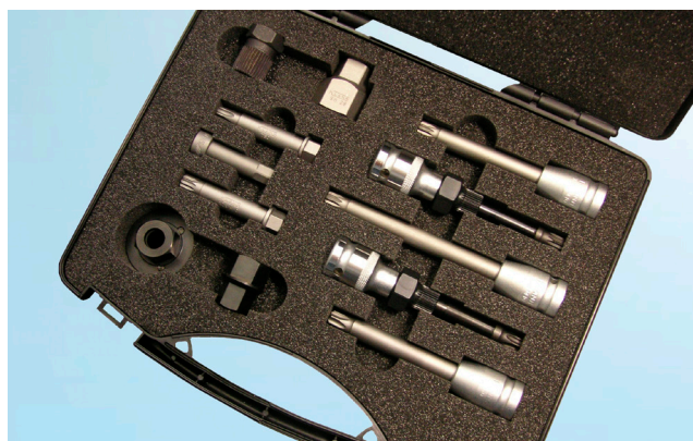
Снимка 3: Специализиран инструмент на INA, част #.400 0241 10

За демонтажа и монтажа на механизма за свободен ход на генератор е необходим специализиран инструмент (снимка 3).