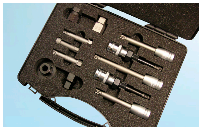
Obrázek 3: INA-speciální nářadí číslo dílu 400 0241 10

Pro demontáž a montáž alternátorové volnoběžky je potřebné speciální nářadí (obrázek 3).