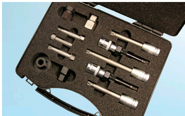
Εικόνα 3: Ειδικό εργαλείο INA, κωδικός ανταλλακτικού 400 0241 10

Ένα ειδικό εργαλείο απαιτείται για την εξαγωγή και τοποθέτηση των τροχαλιών δυναμό με καστάνια (εικόνα 3).