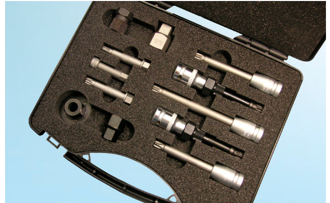
Kuva 3: INA-asennustyökalaraja (Tuoteno INA. 400 0241 10)

Kuvassa 2 on INA-laturin vapaapyörä, jonka Schaeffler Automotive Aftermarket tarjoaa varaosamarkkinoille. Asennuksessa suositellaan käytettäväksi INA-erikoistyökalarajaa (kuva 3).