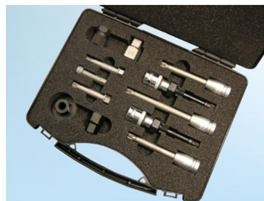
Photo 3 : Outils spéciaux INA réf.400 0444 10

La photo 2 montre la poulie à roue libre d'alternateur proposée par Schaeffler Automotive Aftermarket pour le marché de la rechange. La pose et la dépose de la poulie à roue libre d'alternateur exigent l'utilisation d'un outil spécial (photo 3).