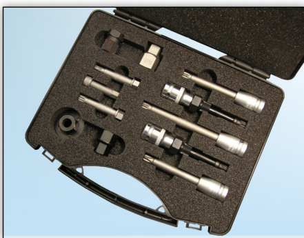
Slika 3: INA-poseban montažni alat, broj dijela 400 0241 10

Obje remenice za prazni hod alternatora bez ikakvih rezervi udovoljavaju tehničkim zahtjevima i razlikuju se samo po izgledu.