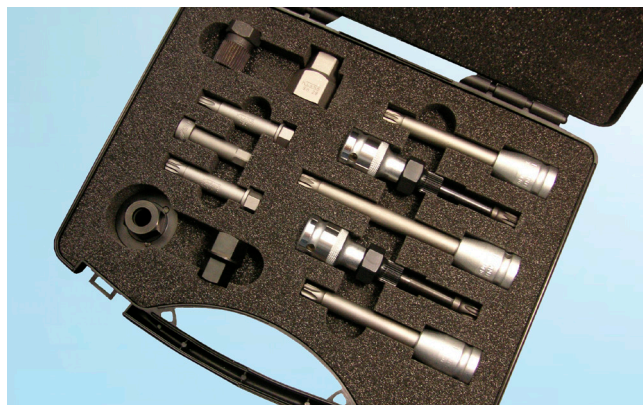
3. ábra: INA célszerszám, cikkszám 400 0241 10

A generátor-szabardonfutók ki- és beszereléséhez egy célszerszám (3. ábra) szükséges.