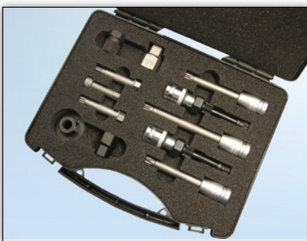
Fig. 3: Speciaal gereedschap van INA artikelnummer 400 0241 10

Beide dynamovrijlooprollen voldoen zonder beperkingen aan de technische specificaties en zijn alleen uiterlijk verschillend.