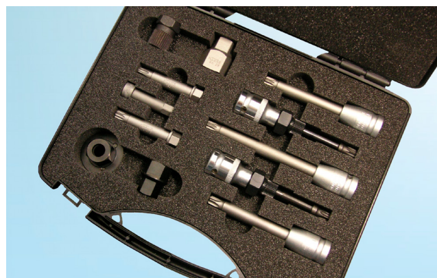
Figur 3: INA spesialverktøy, delnr.: 400 0241 10

De to friløpsremskivene OAP er fullt ut i samsvar med de tekniske kravene og er bare forskjellige i deres utseende.