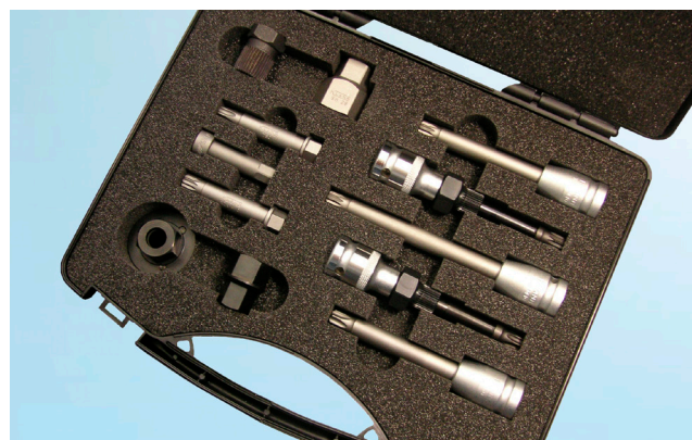
Figura 3: Instrument special INA nr. piesă 400 0241 10

Demontarea/montarea fuliei de alternator cu sistem de rolă liberă se efectuează cu ajutorul unui instrument special (Fig. 3).