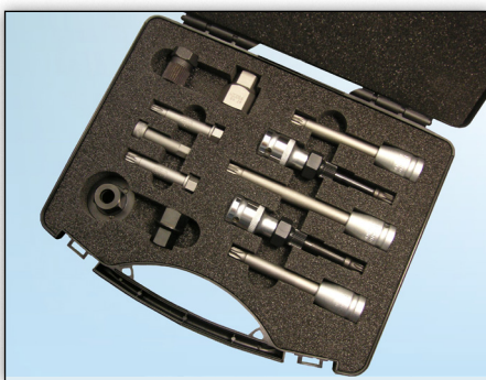
Obrázok 3: INA-špeciálne náradie číslo dielca 400 0241 10

Obe alternátorové voľnobežky zodpovedajú bez obmedzenia technickým požiadavkám a líšia sa iba optickým vzhľadom.