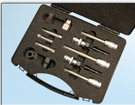
Slika 3: Specialno orodje proizvajalca INA s številko dela 400 0241 10

Prostotečni jermenici alternatorja sta popolnoma v skladu s tehničnimi zahtevami, razlikujeta pa se zgolj po videzu.