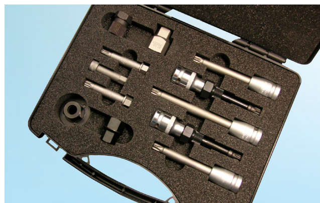
Bild 3: INA specialverktyg nr. 400 0241 10

För demontering och montering av generatorfrinav behövs specialverktyg (bild 3).