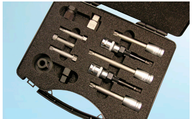
Зображення 3: Спеціальний інструмент INA з артикульним номером 400 0241 10

Для демонтажу та монтажу шківа генератора з обгінною муфтою потрібен спеціальний інструмент (зображення 3).