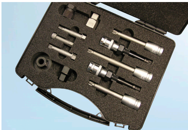
Снимка 3: Специализиран инструмент на INA, част 400 0241 10

Съблюдавайте спецификациите на производителя на автомобила!