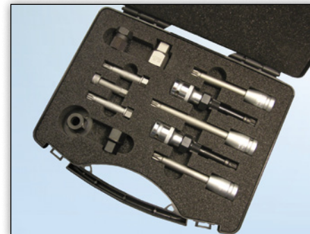
Figura 3: Herramienta especial INA Número de artículo 400 0241 10