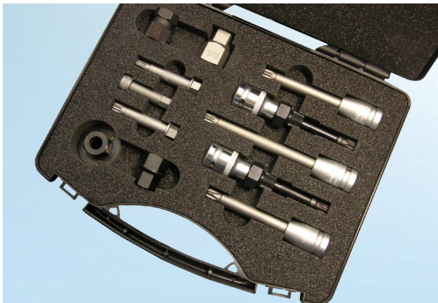
Kuva 3: INA-erikoistyökalut til.nro 400 0241 10

Viittaukset alkuperäisnumeroihin ovat viitteellisiä.