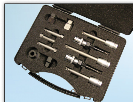
Slika 3: INA-specijalan alat za ugradnju, br. za narudžbu 400 0241 10

Za ugradnju i skidanje remenica slobodnog hoda alternatora potreban je poseban alat za ugradnju ( slika 3 ).