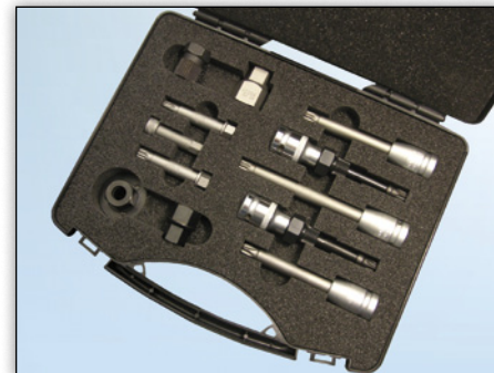
Figura 3: Utensile speciale INA Numero articolo 400 0241 10