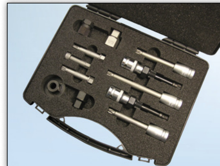
Fig. 3: Speciaal gereedschap van INA artikelnummer 400 0241 10