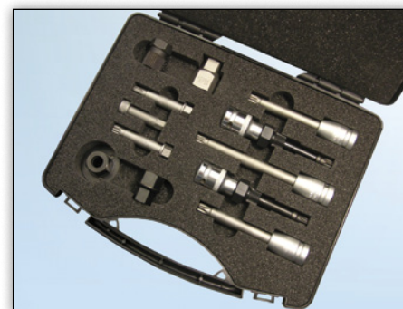
Foto 3: Specjalne narzędzie INA Nr ref.: 400 0241 10