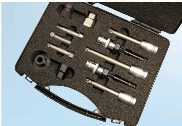
Figura 3: Instrument special INA nr. piesă 400 0241 10

Respectați specificațiile producătorului autovehiculului!