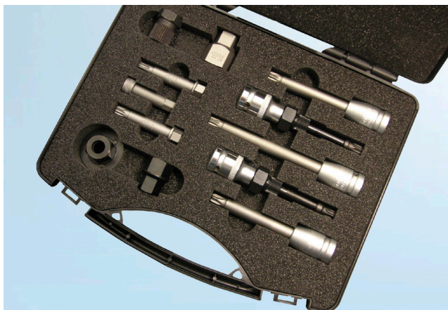
Рисунок 3: Специнструмент INA 400 0241 10

Соблюдайте рекомендации автопроизводителя!