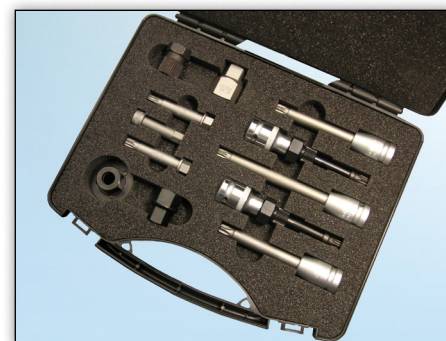
Slika 3: Specialno orodje proizvajalca INA s številko dela 400 0241 10