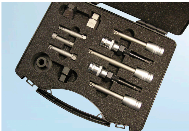
Зображення 3: Спеціальний інструмент INA з артикульним номером 400 0241 10

Дотримуйтеся рекомендацій виробника транспортного засобу!